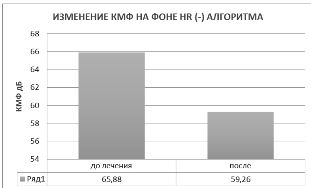
Рис. 6. Динамика тонуса аккомодации после воздействия HR(-) алгоритмом Fig.6. Dynamics of accommodation tone after the HR(-) algorithm intervention

В ГР. № 1 после МФТ с алгоритмом HR(-) коэффициент микрофлюктуаций снизился с 65,88 дБ до значений нормы: 59,26 дБ (рис.6).