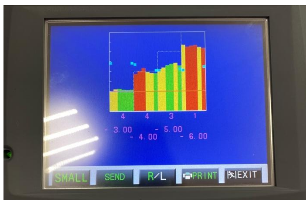
Рис. 2. Цветовое картирование аккомодограммы

Степень напряжения цилиарной мышцы классифицируется цветом. Слабое напряжение соответствует зеленому цвету, сильное — красному, промежуточное — желтому.