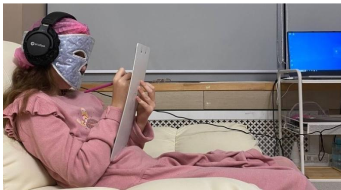
Рис. 3. Сессия Мезо-Форте терапии

Процедура проводится следующим образом: пациент принимает комфортное положение в кресле, на лицо надевается специальное устройство — магнитная маска-преобразователь «Бонни-Гранд», выполненная из двух спаянных между собой слоев полимерного материала, между которыми располагаются магниты, обеспечивающие равномерное распределение силовых линий магнитного поля.