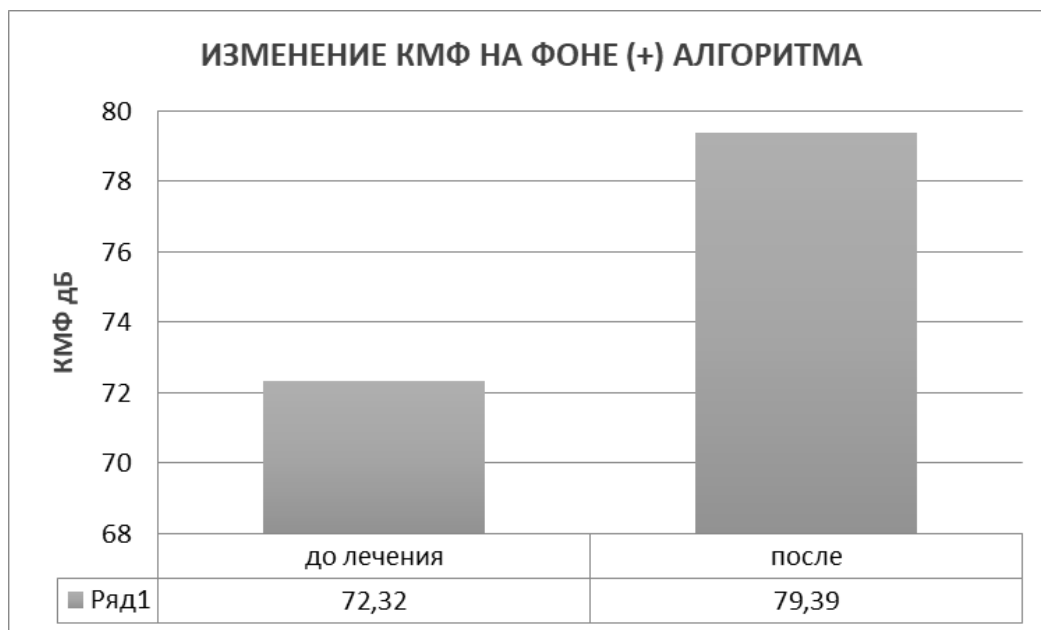
Рис. 7. Динамика тонуса аккомодации после воздействия HR(+) алгоритмом Fig.7. Dynamics of accommodation tone after the HR(+) algorithm intervention

В ГР. № 2 с алгоритмом HR(+) коэффициент микрофлюктуаций наоборот повысился с 72,32 дБ до значения в 79,39 дБ (рис.7).